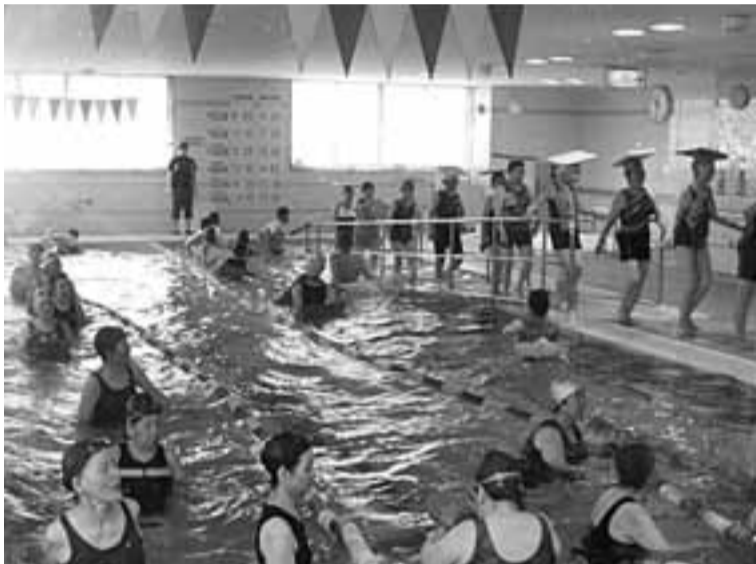
温水プールでスイ、スイ(健康増進水泳事業)

平成18年4月から市立西高齢者福祉センターの指定管理者として、60歳以上の高齢者を対象に各種相談・健康の増進・教養の向上などを図ることを目的として無料で次の事業を行っています。 ・高齢者の健康相談・生活相談 ・生業および就労の指導・相談 ・機能回復訓練 ・教養講座 ・健康教室 ・折り紙教室 ・絵手紙教室