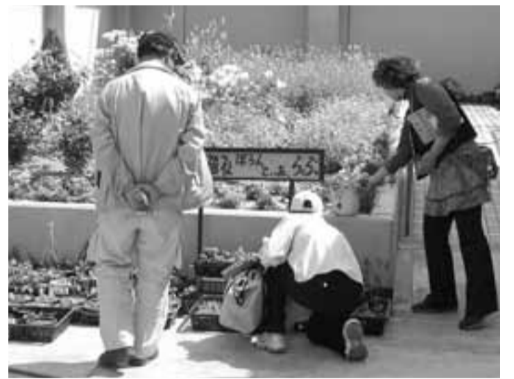
屋上菜園事業でうるおいも

・ヘルスアップ平日会員 ・ヘルスアップ日曜・木曜会員 年間を通じて2回、自分の目的によって、自由に泳や水中歩行ができる会員制度です。 ・ヘルスアップ日曜・木曜会員 年間を通じ毎日曜日または、毎木曜日、自由に泳や水中歩行ができる会員制度です。 ・ヘルスアップ平日会員