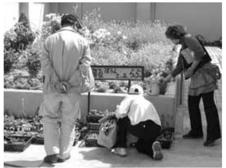
屋上菜園事業でうるおいも

およびヘルスアップ日曜・木曜会員は随時申込受付を行っています。 ・健康増進水泳事業 ・ヘルスアップ平日会員 年間を通じて2回、自分の目的によって、自由に泳や水中歩行ができる会員制度です。 ・ヘルスアップ日曜・木曜会員 年間を通じ毎日曜日または、毎木曜日、自由に遊泳や水中歩行ができる会員制度です。 ・ヘルスアップ平日会員