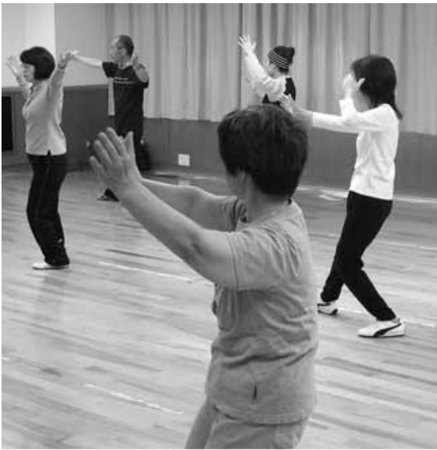
ゆっくり、しなやかに太極拳教室

身体機能の低下は加齢によつて起こるだけでなく、活動量が少なくなる事により起こることのほうが多いといわれています。今のうちから、身体機能の低下を予防し、いつまでも生き生きとした生活を送ることができるよう、日頃から定期的に運動を行う習慣をつけてみませんか。