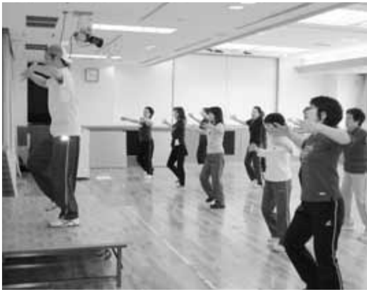
みんなで楽しくストレス発散(エアロビクス教室)