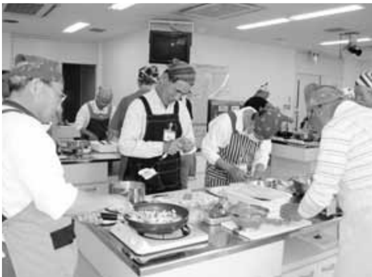
協力しあって奮闘中

市内に住所を有するおおむね65歳以上で、虚弱であるために軽度の援助を必要とする人 ひとり暮らしの人または高齢者のみの世帯の人 介護保険の要介護認定で「自立」と認定された人、または認定を受けていない人 申込み、お問合わせは市高齢介護室まで。☎838-0372