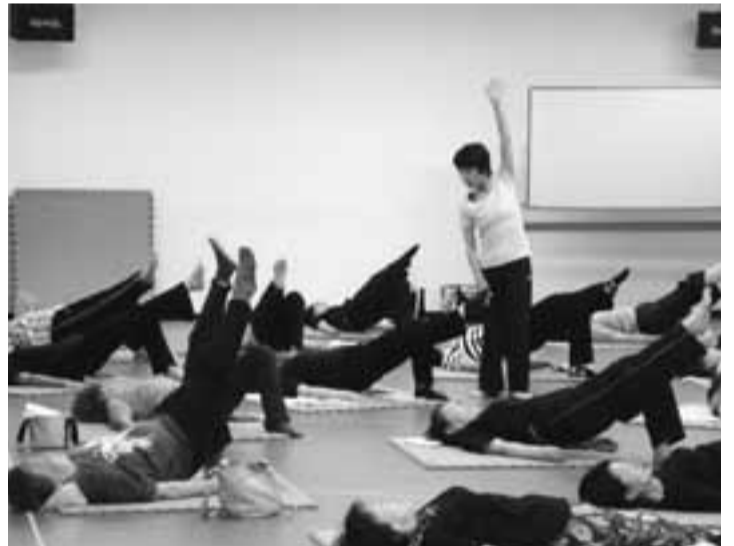
みんなでリラックス(ヨガ体操教室)

自分のペースで行う。距離や時間に対して頑張り過ぎない。特に最後に「もう一回」と頑張らない」からといって、恥ずかしいと思う意識は捨て、自分のペースで行う。